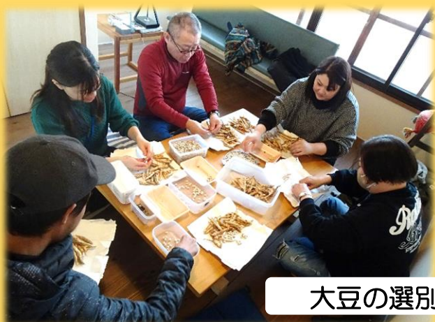
大豆の選別 グループ