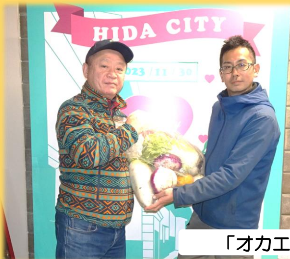
「オカエシ」を寄付しました