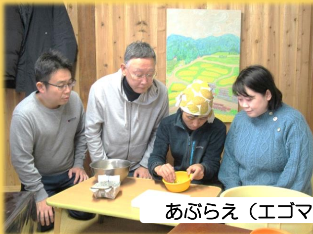
あぶらえ (エゴマ) の選別 グループ